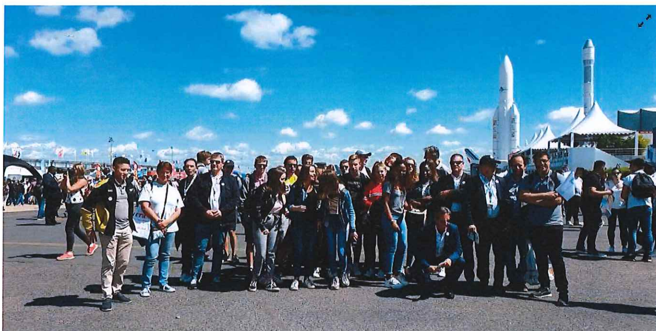
Le groupe d'élèves sur le tarmac du Salon du Bourget.