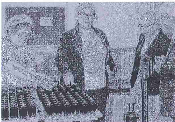
Des millions de flacons pour des marques de luxe sortent de l'usine Val Laquage chaque année.

Si la société Val Laquage se porte bien, il reste les exigences