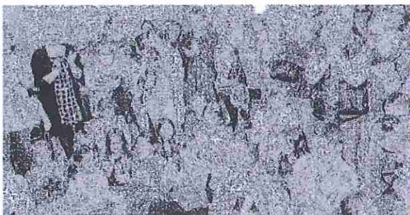
Le spectacle attendrissant a été salué par des applaudissements.

Les mamans ont été à l'honneur vendredi 27 mai à Varengeville. C'est une tradition pour les écoliers de célébrer cette fête familiale autour d'un petit spectacle comprenant quelques poésies, beaucoup d'attention et des roses offertes à chaque maman.